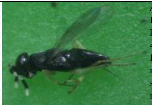
Tabel 2. Karakteristik Morfologi Anagyrus lopezi

A. lopezi memiliki ciri-ciri tubuh yang kuat dan kokoh. Imago A. lopezi berwarna hitam mengkilap dengan kisaran panjang 1.2 – 1.5 mm. Bagian kepala memiliki 4 ruas funikel, 4 ruas palpus maksila serta 3 ruas palpus labium. Imago betina memiliki skapus lebar dan rata, 3 ruas clavus, dengan bagian funikel lebih panjang dari skapus pada setiap ruasnya. Memiliki tungkai yang ramping (Noyes dan Hayat 1994).