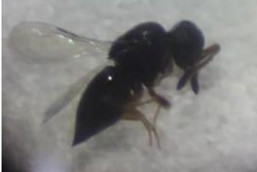
Tabel 4. Karakteristik Morfologi Blepyrus insularis

Kepala dan thorax berwarna hitam-metallic-violet hingga ke aeneous; antenna berwarna coklat gelap. Antena berbentuk silinder scape-corong dengan enam-segmen, semua segmen digerakkan oleh sistem saraf yang lebar dan panjang. Dari segmen pertama semakin lebar hingga bagian segmen ke-6. Sayap depan dengan vena postmarginal lebih panjang dari vein stigmal.