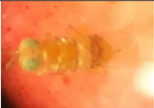
Tabel 3. Karakteristik Morfologi Acerophagus papayae

Panjang tubuhnya 0,85 mm. Kepala berwarna oranye pucat, memiliki mata majemuk kehijauan, dan mata ocelli berwarna merah. Bagian torak berwarna oranye pucat, bagian scutellum. Sisi torak lateral dan tungkai sedikit lebih pucat daripada sisi torak dorsal. (Noyes & Schauff, 2003).